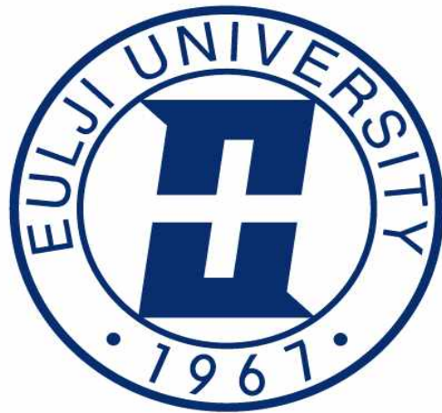
※ 2022학년도 편입학모집 전형방법 안내 ※